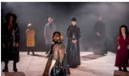
Elckerlijc door URLAND

Deze afbeelding van de voorstelling Elckerlijc deed me denken aan de middelbare school. Ik begreep er toen bar weinig van. Waar ging dit